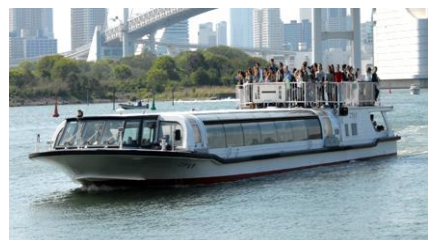
水上バス「こすもす」

申込方法 裏面の参加申込書に必要事項をご記入のうえ、 当技士会まで FAX（03-3552-5832）を 送信ください。申込み完了後、受付印を押印し、FAX にて返送いたします。 なお、申込者多数により締切の場合、ご連絡差し上げます。