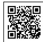
JAL メンテナンスセンター アクセス QR コード