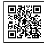
JAL 安全啓発センター QR コード

施設内は、1985 年 8 月の JAL123 便事故に関する多くの展示を行い、事故の直接原因とされる後部圧力隔壁を始めとする同機の残存機体、コックピットボイスレコーダー、デジタルフライトデータレコーダー、当時のマスコミ報道など、日本航空の安全の原点とも言えるこの事故についての資料が展示されています。