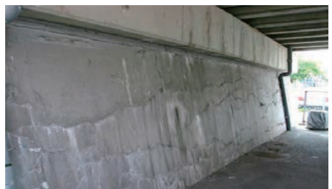
図-4 補修後の再劣化