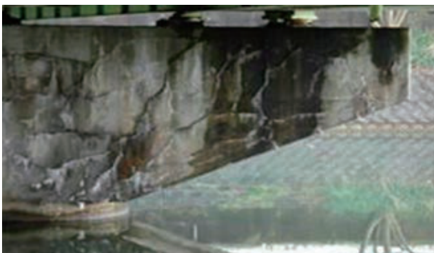
図-1 橋脚はり部のひび割れ

一方、プレストレストコンクリート構造物ではPC鋼材に沿った方向性のあるひび割れが多く見られます。図-2は