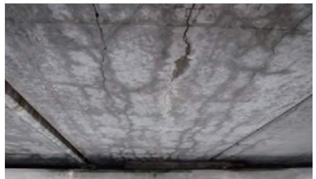
図-2 PC桁下面のひび割れ

ASR(アルカリシリカ反応)とは、コンクリート中の反応性骨材がセメント由来のアルカリ分と反応して生成したア